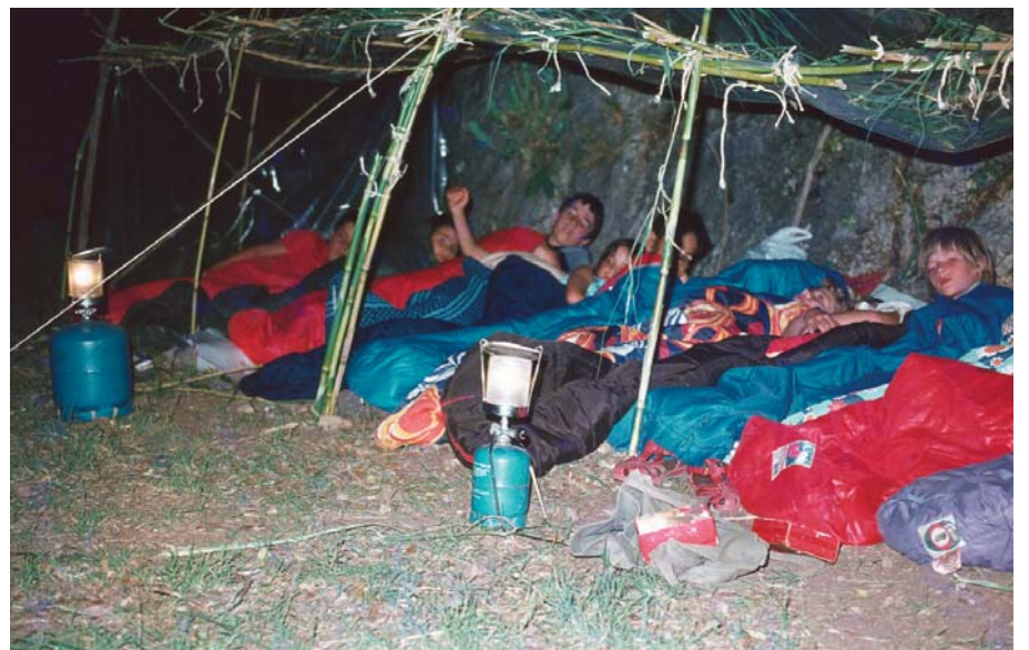
Llops i Daines, camp d'estiu a Beceit 1982