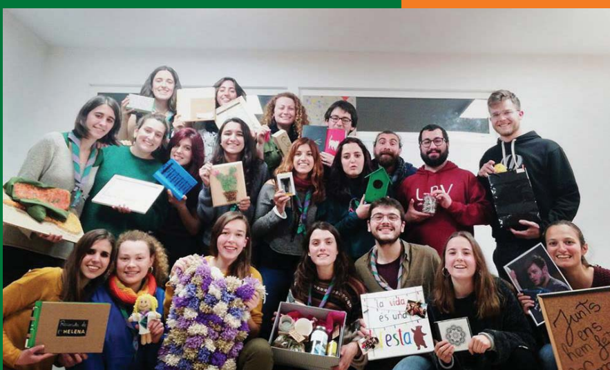
Amic Invisible dels caps. Febrer 2018.