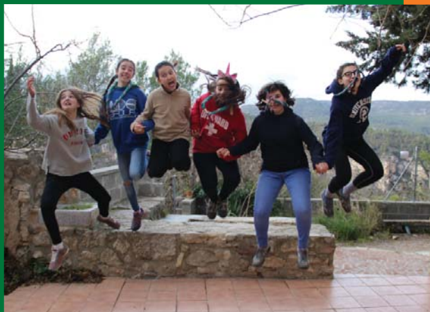
Ràngers i Noies Guia al camp d'hivern a Querol.