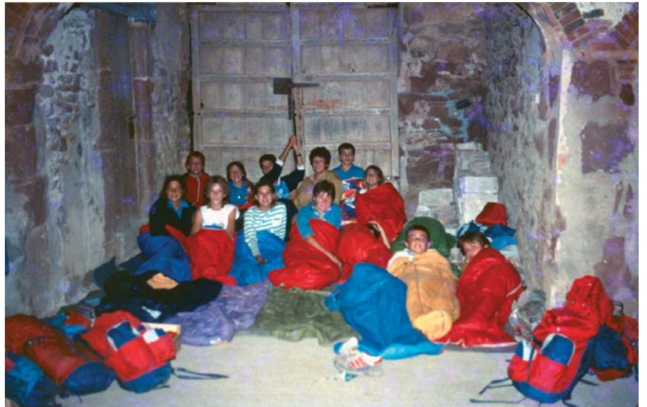
Ràngers i Noies Guia, cap d'estiu a Capafons 1986

Els que hem viscut les excursions del Cau segur que recordem aquells moments del silenci de la nit, dins del sac, fent-la petar, compartint, rient i..., de vegades, percebent la humanitat dels companys i companyes.