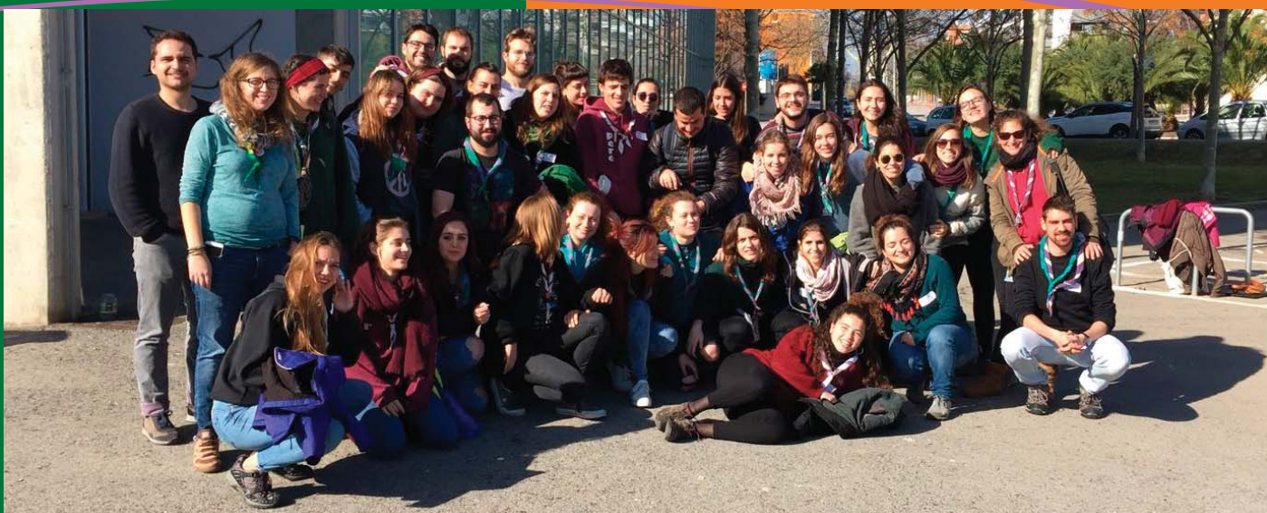
Primera trobada del Procés d'Unitat, amb caps dels 3 moviments de la Federació Catalana d'Escotisme i Guiatge. 29/1/2018.