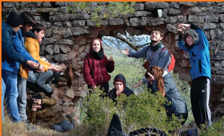
Pioners i Caravel·les al camp d'hivern a Font Rubí.