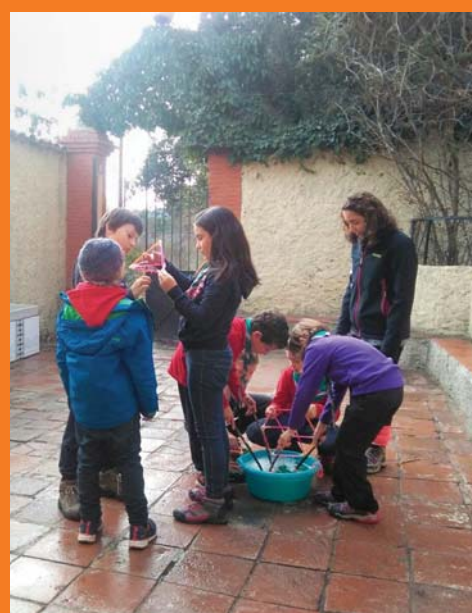
Llops i Daines a la Pobla de Claramunt.