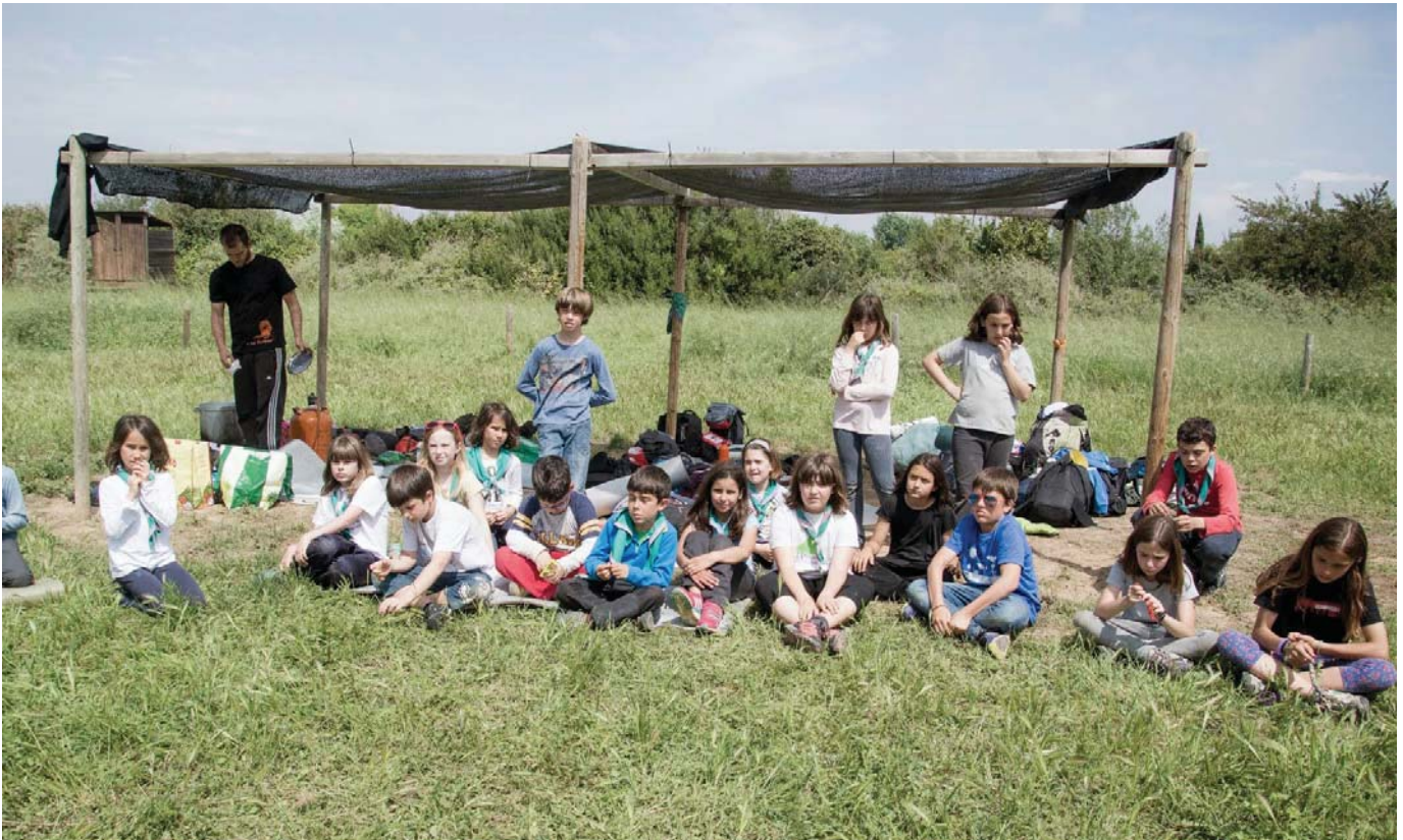
Llops i Daines de l'Alverna a l'Hort de la Sínia, abril de 2015.