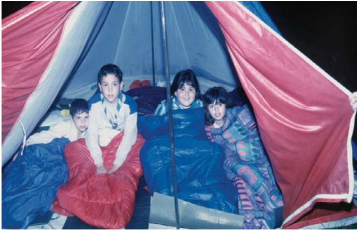
Llops i Daines, camp d'estiu a Olot 1993